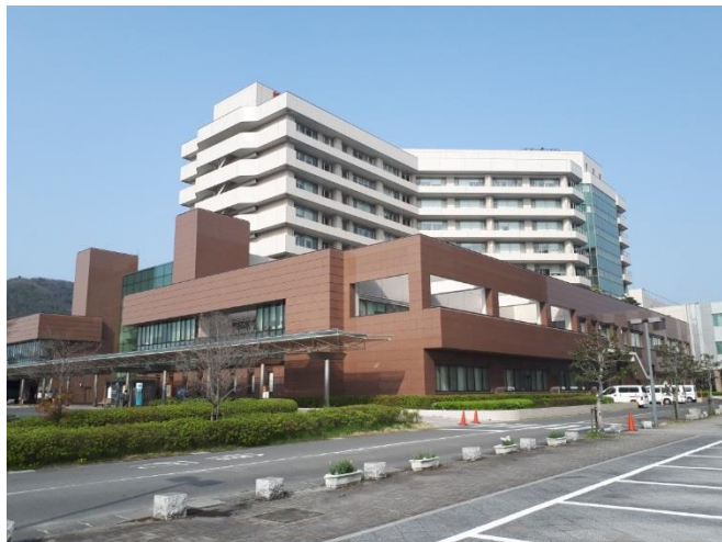
・岐阜大学医学部附属病院 全景