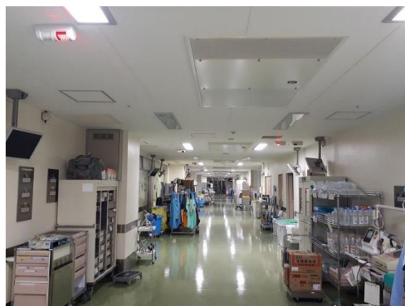
・病院内（手術室周辺）